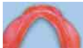
Unterfütterung nach über 2 1/2 JAHREN