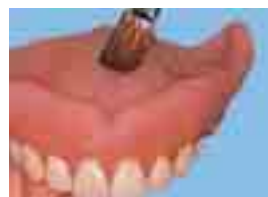
Unterfütterung 5 1/2 min.

Besonders angenehm ist die weitestgehende Geschmacks- und Geruchsneutralität: ein echter Fortschritt.