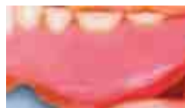
Feste Prothesenränder nach über 2 1/2 JAHREN

Über Jahre hinweg haftet SOFRELINER TOUGH fest an der Prothese. Das Produkt der neuen Generation verbessert die Trageigenschaften spürbar.